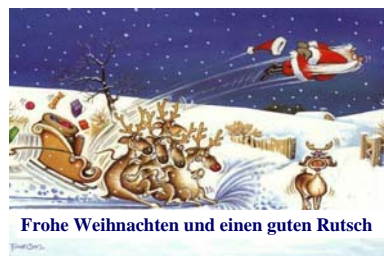
Frohe Weihnachten und einen guten Rutsch